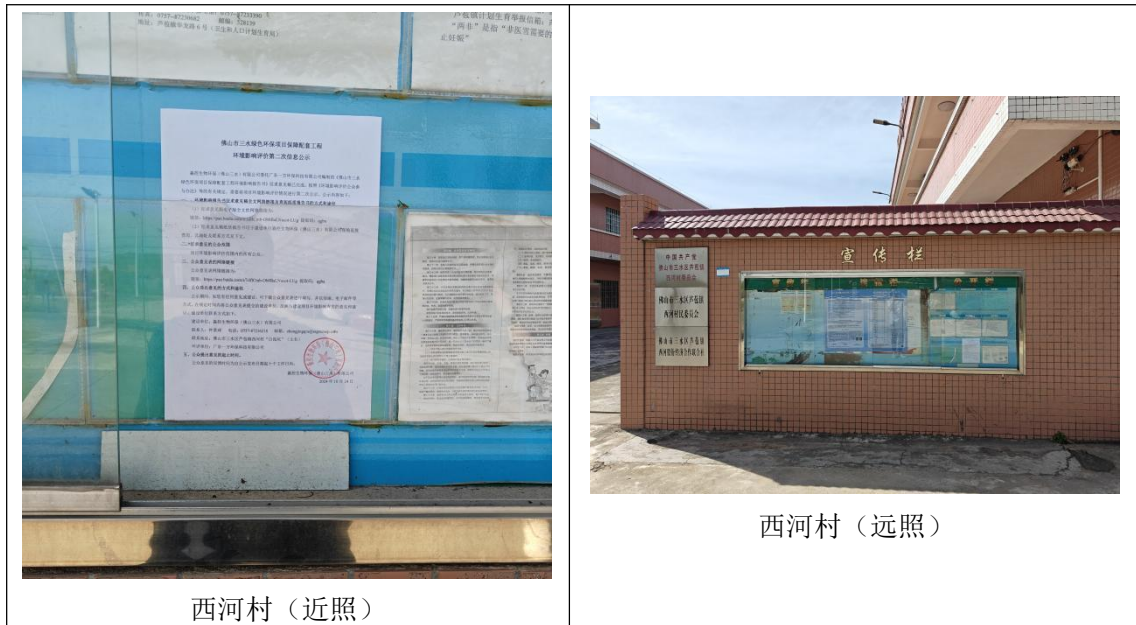
图 4 征求意见稿公示现场张贴照片